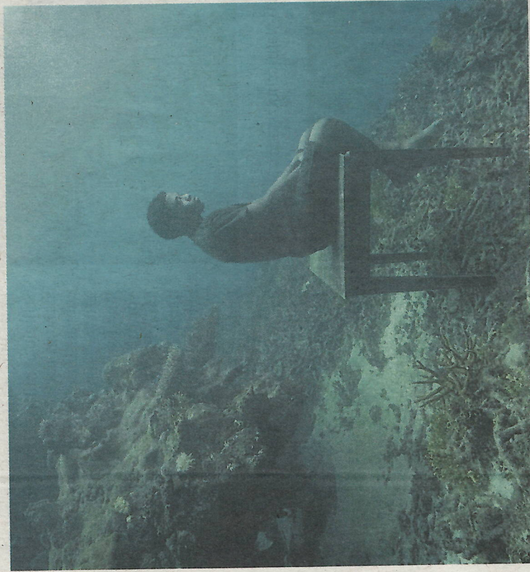
Petero by Cliff, Fiji 2023

gerettete Wesen, die an den Menschen gewöhnt sind und niemals wieder in die freie Wildbahn entlassen werden können. Der Nebel soll dabei ein Symbol sein für die natürliche Welt, die immer mehr aus dem Blickfeld verschwindet. Er soll ein Echo des Rauchs der Waldbrände